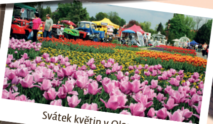
Svátek květin v Olomouci