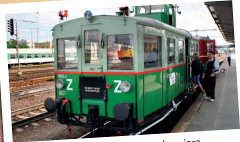
Historickým vlakem na oslavu jara