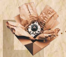
získání 1. ocenění „Obal roku“