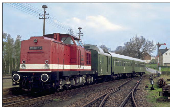
Nicht minder typisch waren Bghw-Wagen in Nebenbahnzügen hinter Dieselloks der Baureihe 110. In Berthelsdorf im Erzgebirge lief (wie so oft) ein Neubau-Packwagen der DR mit.