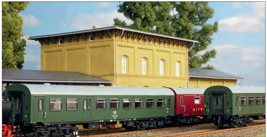
Im Foto oben der Halbgepäckwagen, dahinter die Speisewagenversion.

Alle Piko-Modelle rollen auf fein strukturierten Drehgestellen der Bauart Görnitz V. Die Kupplung könnte enger sein.