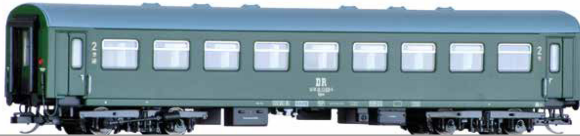
Abbildung zeigt 16624

Art.-Nr. 16620 • 16621 • 16622 • 16623 • 16624