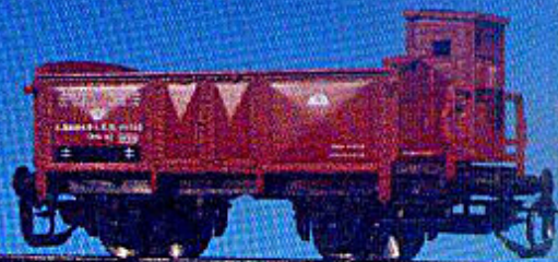
O-Wagen der k.sä.St.B. mit Bremserhaus (Epoche I)