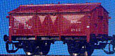
Sandwagen der DR, Typ Wuppertal, (Epoche III)