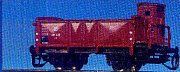
O-Wagen der DB mit Bremserhaus (Epoche III)