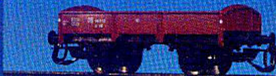
Niederbordwagen der DB (Epoche III)