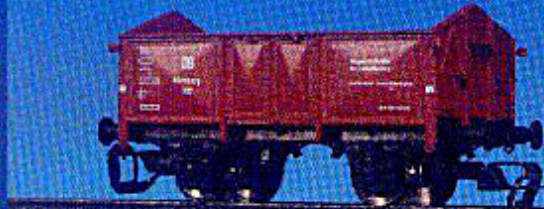
Abfallwagen-Wagen der DB (Epoche III)