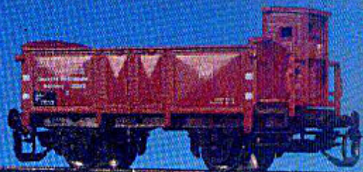
O-Wagen der DRG mit Bremserhaus (Epoche II)